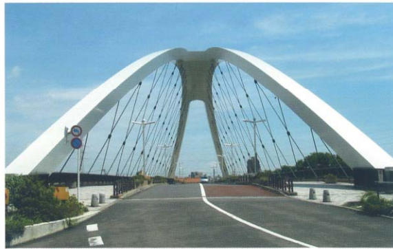
江戸川区辰巳新橋