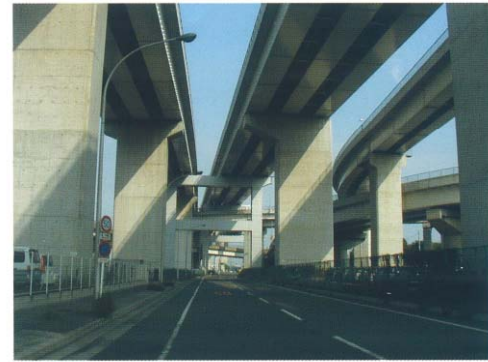
伊勢湾岸自動車道