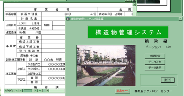
構造物管理システム 橋梁編